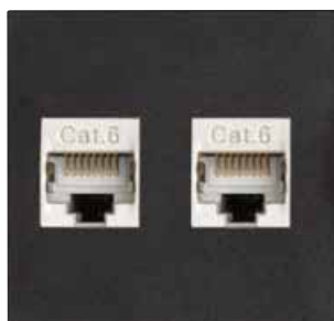
2 x RJ45 CAT6