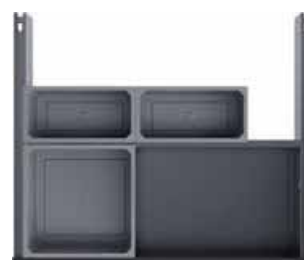
ilustrační obrázek: rozsah dodávky 1 ks nádoba 1,2 a 1 ks nádoba 2,7 litrů