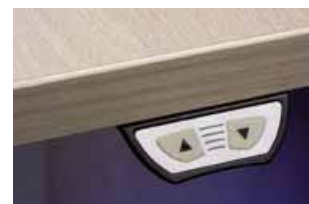
ovladač s funkcí nahoru/dolů