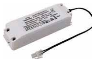
síťový zdroj bez funkce stmívání

Síťový napájecí zdroj s integrovanou ochranou proti přepětí a zkratu.