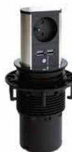
1 x zásuvka 2 x USB nabíječka