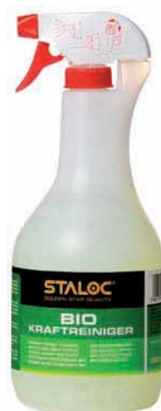
lahev s rozprašovačem