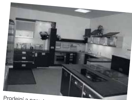
Prodejní a poradenské centrum v Brně

Později byla pobočka přesunuta do ulice Křenová, kde v kancelářích v prvním patře již komunikaci se zákazníky plnohodnotně zastával telefonní prodej. V přízemí pak bylo možné navštívit showroom, kterému dominovala rohová funkční kuchyně s ostrůvkem.